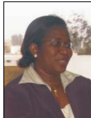
Hon Houa Dia Thiam, Co-présidente du PAPP et Députée de l'Assemblée nationale du Sénégal